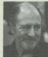
Michel Delpech

Delpech werd in 1946 in de buurt van Parijs geboren en groeide op als bewonderaar van Gilbert Bécaud en Charles Azna-