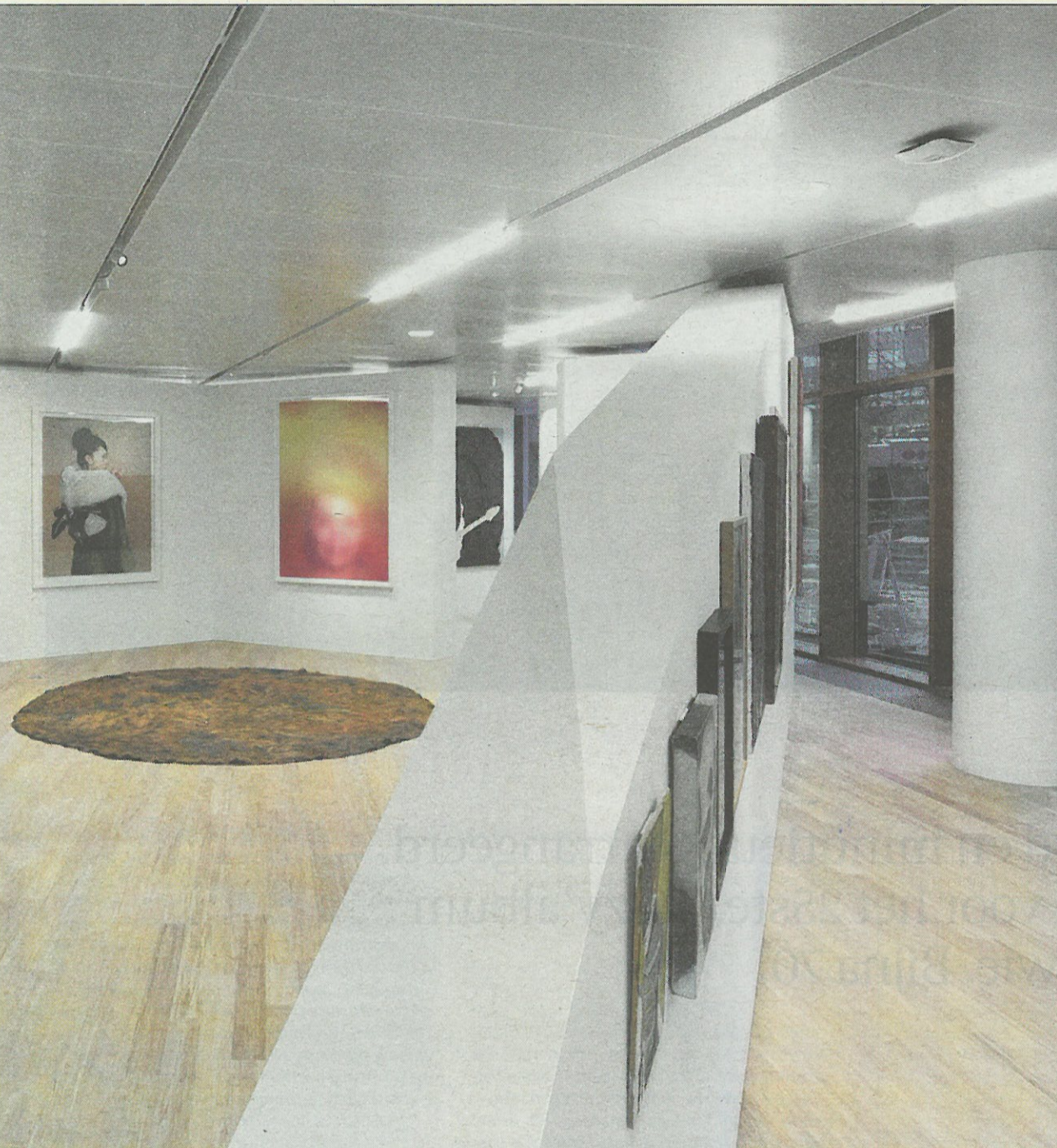
werk van onder anderen Anton Henning, Stephan Balkenhol en Susan Hiller.