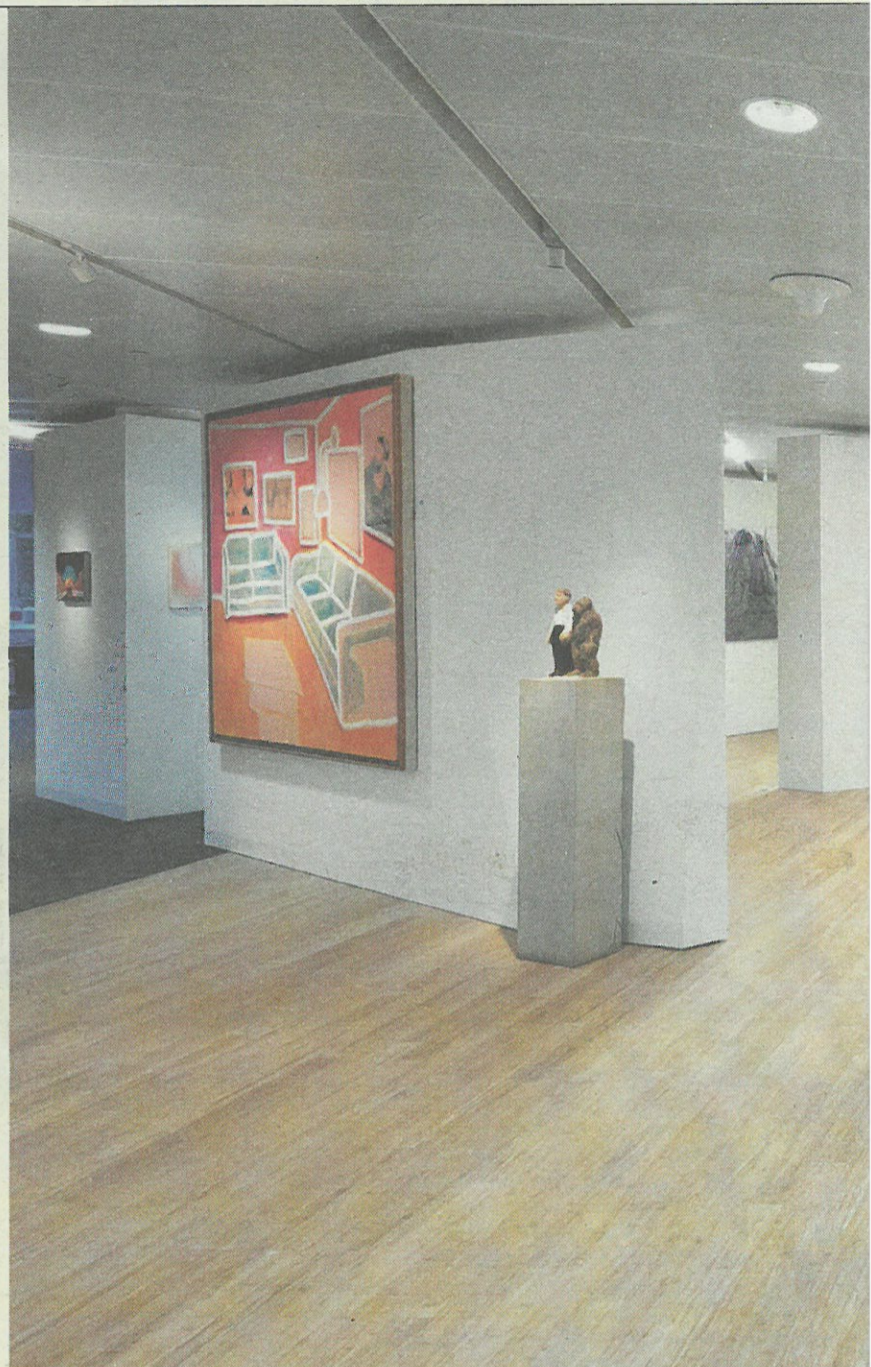
De galerie AkzoNobel Essential Art Space op de Amsterdamse Zuidas, met