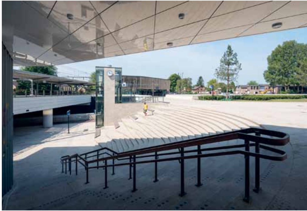
Net als het stationsplein is ook het plein onder het spoor bestraat met lichtgeel graniet.