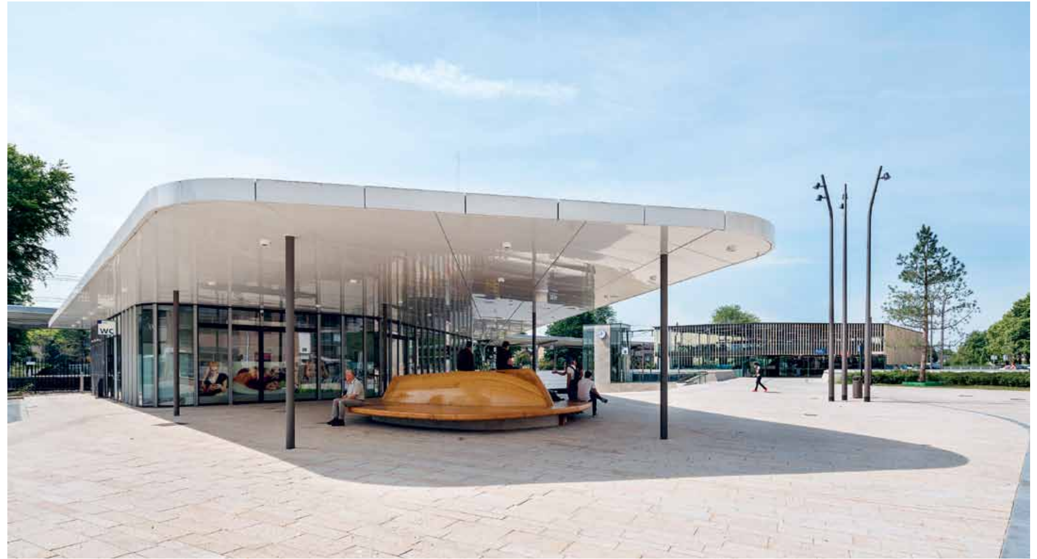
De royale luifel maakt van het nieuwe stationsgebouw een eyecatcher. Op de achtergrond de fietsenstalling.