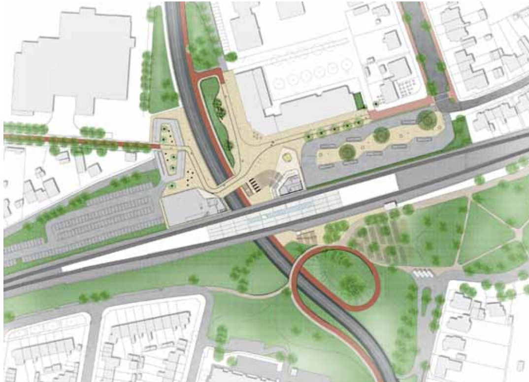
Ontwerp voor het stationsgebied. Aan de noordkant van het spoor het nieuwe stationsplein. Aan de zuidkant de slinger die het park verbindt met het station en het Harderwijkse centrum.